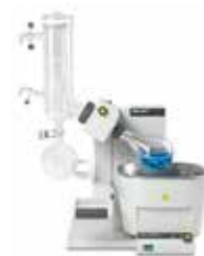
R-300 5Lバス/電動リフト C型コンデンサー P+G