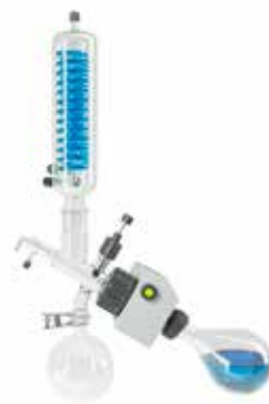
S型コンデンサー 全環流型 P+G