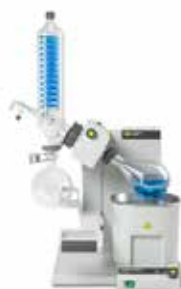
R-300 1Lバス/電動リフト V型コンデンサー※ P+G