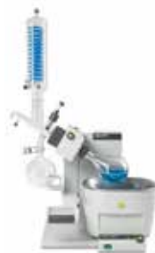
R-300 5Lバス/電動リフト S型コンデンサー P+G