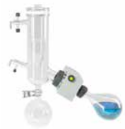
C型コンデンサー 低沸点型 P+G