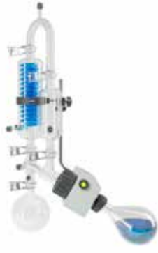
E型コンデンサー 飛沫同伴防止型 P+G