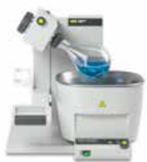
R-300 5Lバス コンデンサーなし