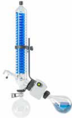
HP型コンデンサー 高効率凝縮型 P+G