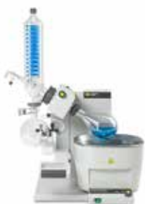
R-300 5Lバス/電動リフト V型コンデンサー※ P+G