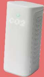
コネクトCO 2 センサ