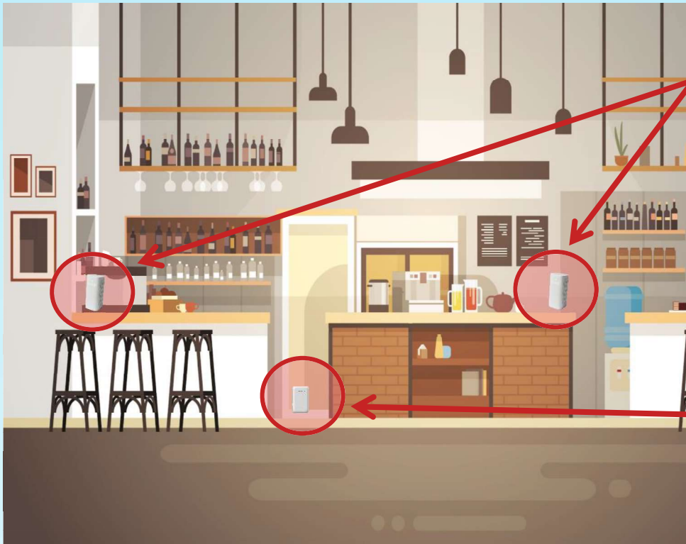
飲食店の設置イメージ

施設内のCO 2 濃度およびスマホ利用者数を測定することで、 「密閉」「密集」「密接」の三密リスクを回避！